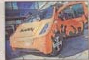
BUDDY En av elbilene i gågata

Det er to typer elbiler representert: Think og Buddy. Think er registrert som en vanlig bil og kommer opp i 110 km/t, mens Buddys høyeste hastighet er 80 km/t.