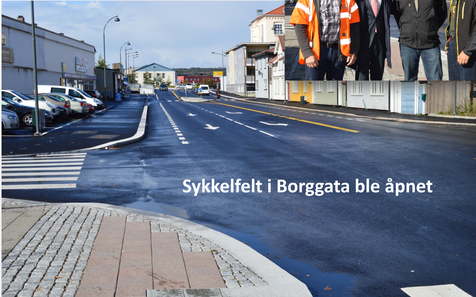
Sykkelfelt i Borggata ble åpnet